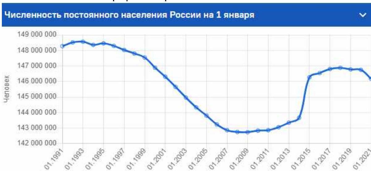
Рис. 1 – Численность постоянного населения России на 1 января (Росстат URL: https://rosstat.gov.ru/ (дата обращения: 20.03.2022)) Необходимо получить прогноз показателя на 1 января 2022 года

Имеется график микроэкономического показателя