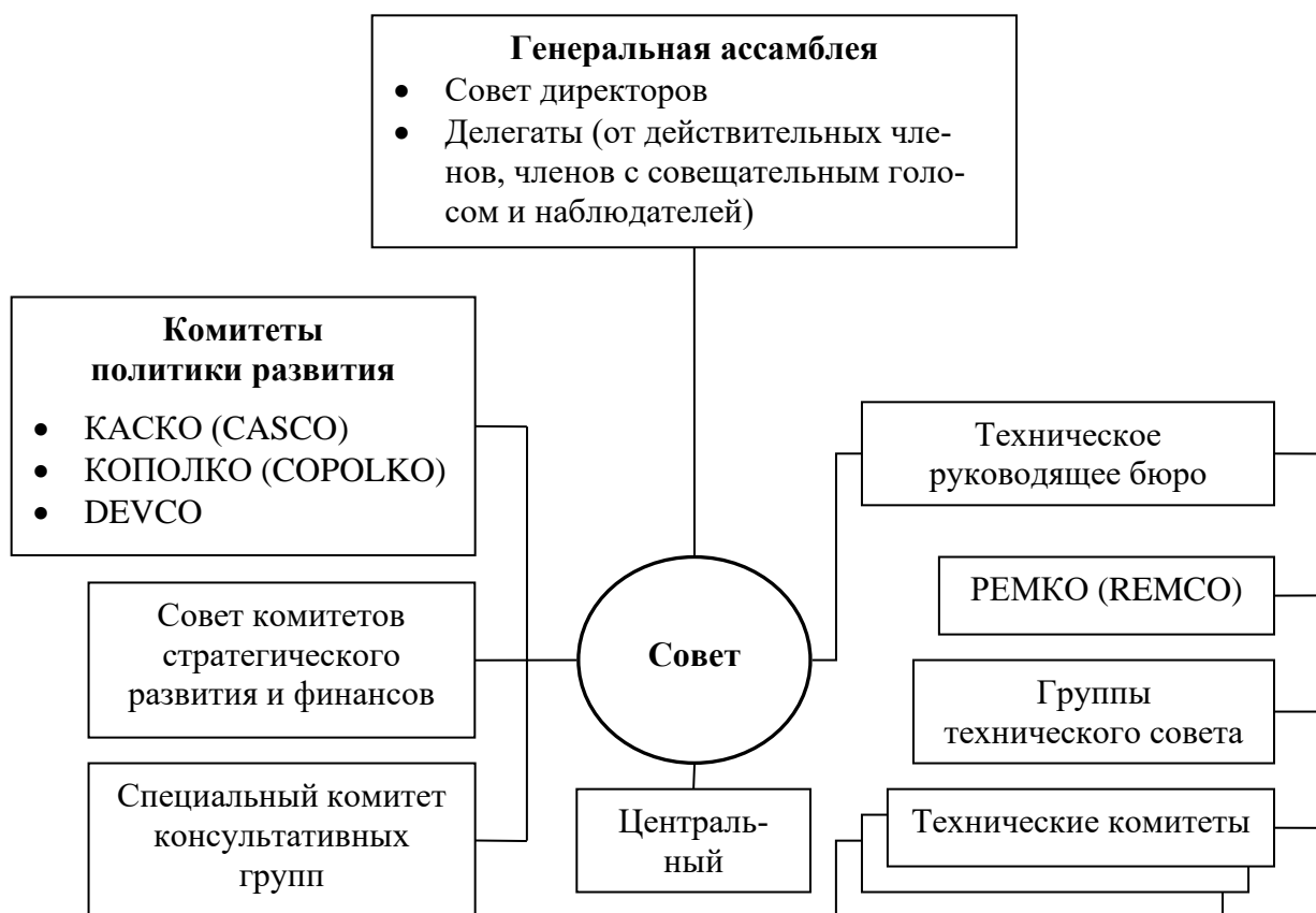
Рис. 5. Структура Международной организации по стандартизации

Проанализируйте структуру ISO (рис. 5), укажите функции и задачи основных комитетов. Раскройте сущность стандартов ISO 9000:2000 и сертификации систем качества?